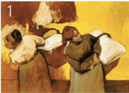
Edgard DEGAS (1834-1917). «Lavanderas llevando la colada», 1876.

REINTERPRETA la obra de tonos fríos que te presentamos, empleando tonos de la gama cálida, de modo que marque tu personalidad y sentimiento, y produzca sensaciones diferentes a las que evoca el autor.