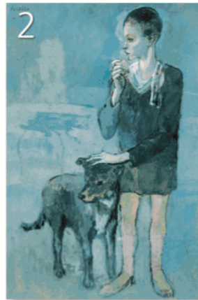
Pablo R. PICASSO (1881-1973). «Muchacho con un perro», 1905.